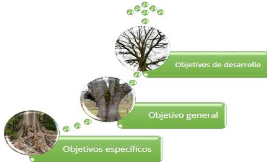
Ilustración 3. Árbol de Problemas