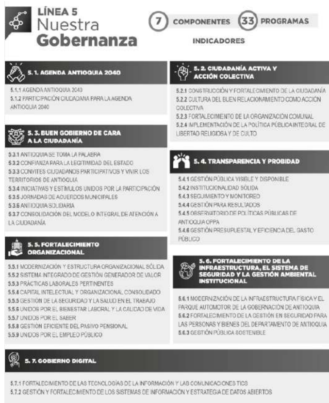
Figura 1. Componentes y programas de la línea

La línea Nuestra Gobernanza cuenta de 7 Componentes con 33 Programas