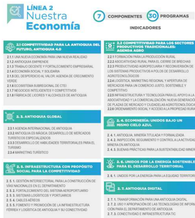
Figura 1. Componentes y programas de la línea

Se aborda en este documento, el análisis de la Línea 2: Nuestra economía, la cual está compuesta por 7 componentes con 30 programas.