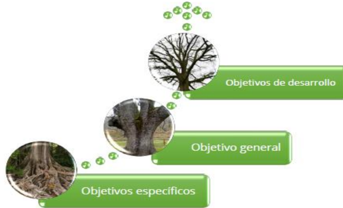
Ilustración 3. Árbol de Problemas