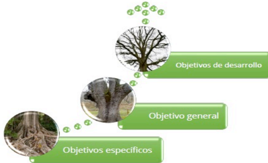
Ilustración 3. Árbol de Problemas