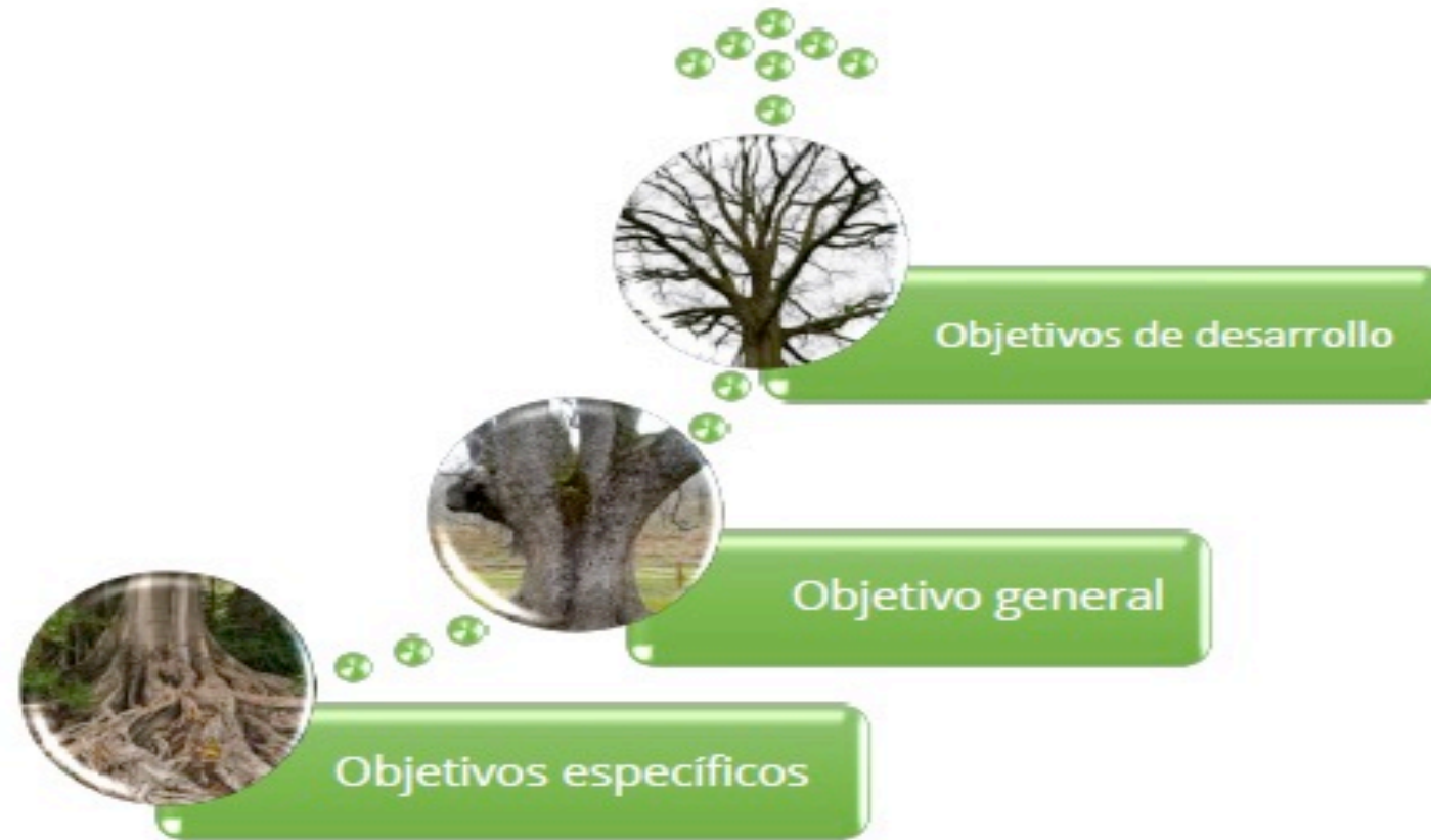
Ilustración 3. Árbol de Problemas